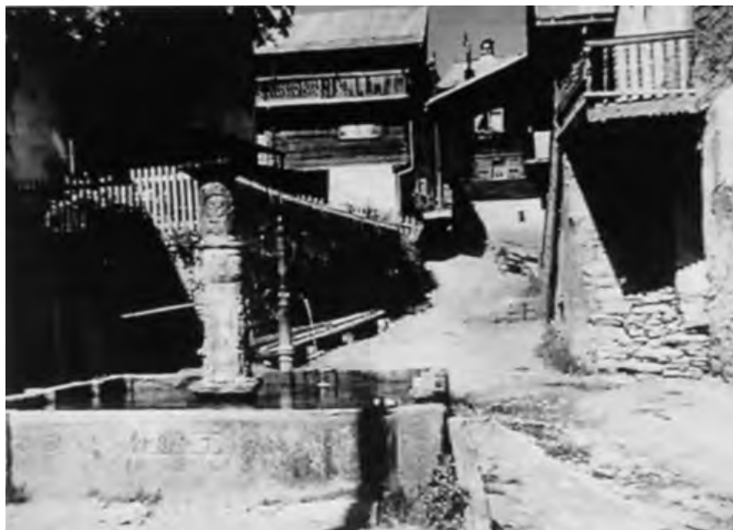
La fontauna gronda da 1847 el center dil vitg da Cumbel. La petga era encoronada cun las armas dallas famiglias las pli veglias burghaisas da Cumbel. Bein visibla ei la gelgia en l'arma dils Arpagaus.