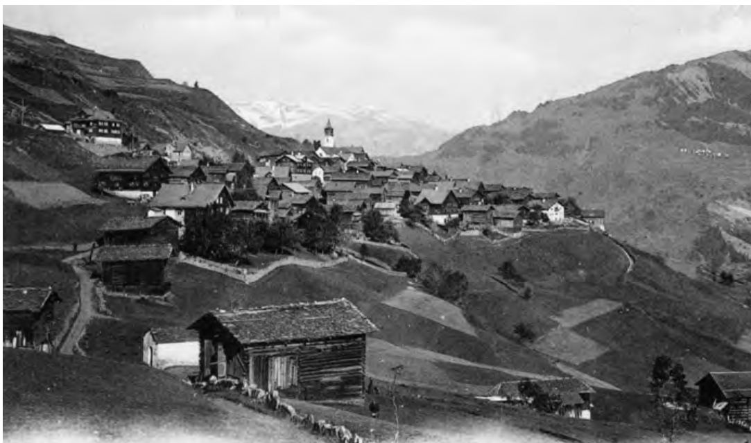
Cumbel entuorn 1900

60 renschs 13 . Suenter il capitulat dils 2 da settember 1639 che ha menau las Ligias en la dependenza da Milaun ei la gronda part dils amitgs dalla Frontscha ella Ligia Grischa ed en Surselva sesuttamessa all'influenza spagnola. Aschia era ils Arpagaus da Cumbel.