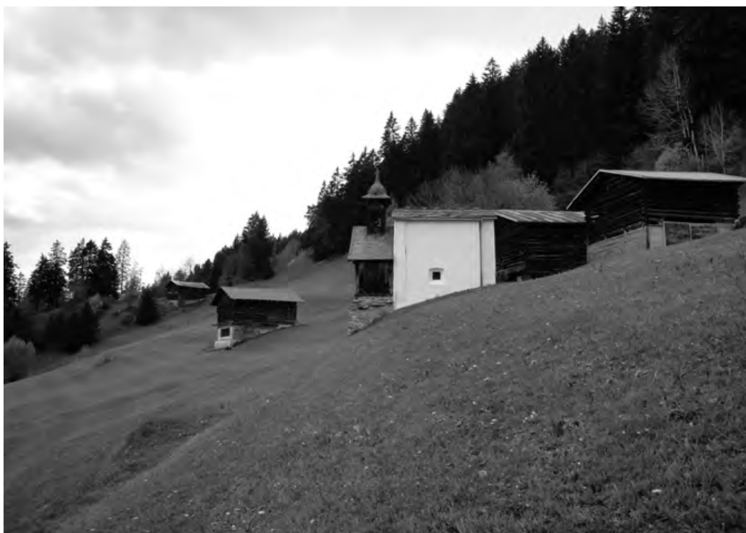
Pugaus cun la caplutta da sogn Clau che schai sin la spunda denter Breil e Schlans sin ina altezia da 1290 m. s. m.